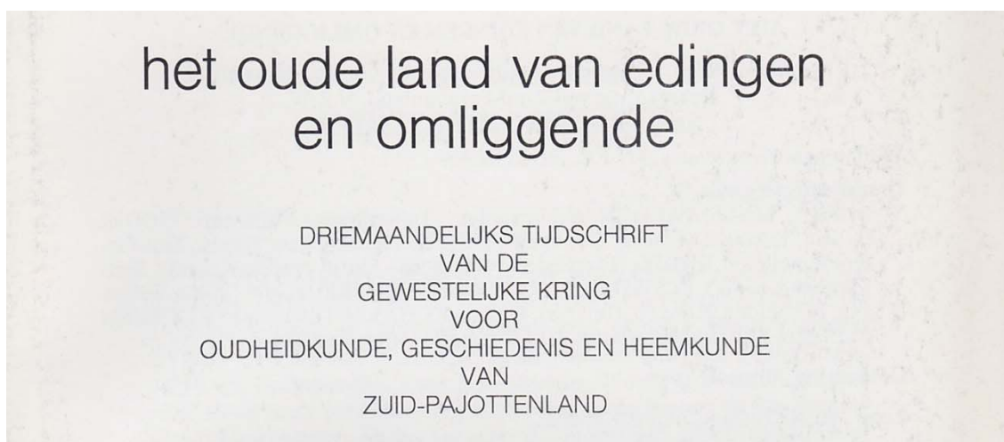
Titelblad van eerste nummer 1989

Haast vier decennia lang zou het tijdschrift van de kring een schat aan artikelen over onze streek publiceren, geschreven door de meest deskundige pennen uit de streek, een schat die we vandaag nog steeds koesteren en, wanneer nodig of mogelijk, ter hand nemen. Het is onbegonnen werk in onze Naklanken een compleet overzicht te geven. Toch een poging om een breed beeld te schetsen en het belang te onderstrepen van zoveel studies en aandachtspunten.